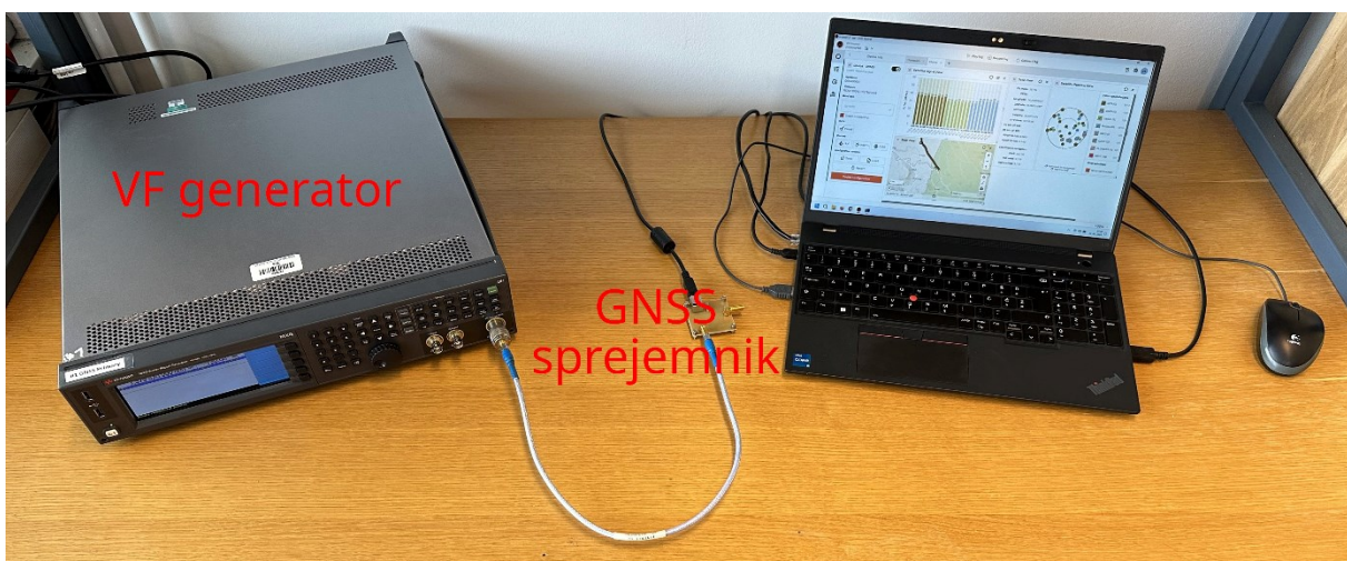
Slika 2: Slika vezave merilnih pripomočkov

Vezavo merilnih pripomočkov prikazuje Slika 3, razporeditev pa Slika 2s.